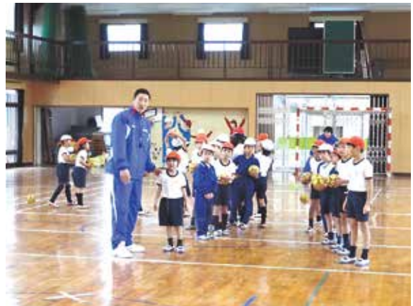
ハンドボール教室

「レオリック」は昭和53(1978)年から、小学校でハンドボール教室も開催しています。「ハンドボールを通じて、夢中になれることを見つけしてほしい」「一生懸命練習をすれば、今日できなかったことが明日はできるようになる、人間やればできる、という努力することの大切さを学んでほしい」「仲間とともに力を合わせることで、チームプレーのすばらしさを味わってほしい」という願いをもって、行われています。この教室では技術だけでなく「周囲の大人や仲間にきちんとあいさつをする」「練習後は、自分たちですみずみまでそうじをする」といった礼儀作法も指導し、人として大切なことを伝えようとしています。