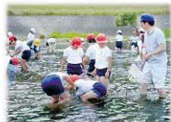
水生生物調査（吉田小学校）

市内の小学校では，江の川（可愛川）やその支流の川の生き物を調査し，その場所の水質を調べています。江の川は，平成16年調査によると中国地方の一級河川では，きれいな川の4位にランキングされています。