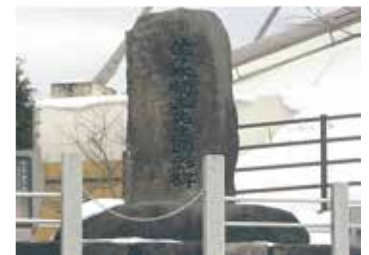
佐々木順三 顕彰碑