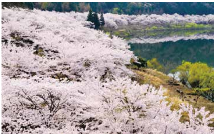
土師ダムの桜(八千代町)

その他にも、安芸高田市には、誇れる自然がたくさんあります。サクラ、カタクリ、ショウブなど、季節の花々にふれられるところもたくさんあります。行ってみると、新たな発見があるかもしれませんね。