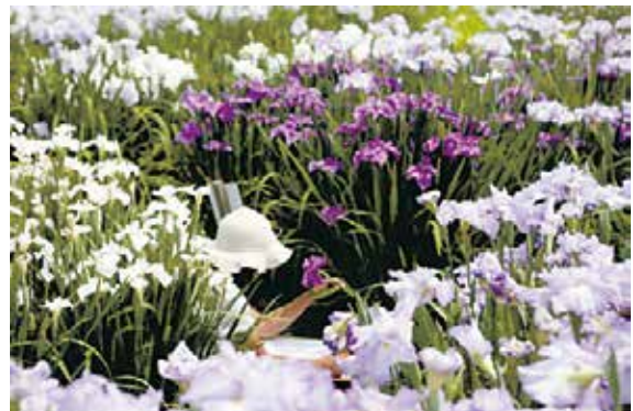
花しょうぶ(向原町)