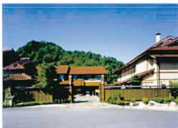
かぐらもんぜんとうじむら 神楽門前湯治村

かぐら 美土里町で「神楽でまちおこしをしよう」という声が高まり、賛成反対の議論のすえ、神楽専門の上演施設「神楽ドーム」を建設することになりました。その工事の途中で温泉がわき出したため、計画が大きくふくらんで、平成10(1998)年、神楽ドームと温泉施設が一緒になった「神楽門前湯治村」がオープンしました。