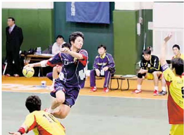
ハンドボールの試合の様子