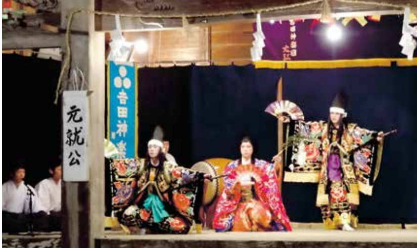
よしだかぐらだん もとなりこう 吉田神楽団「元就公」

吉田町の吉田神楽団では創作神楽「元就公」の継承に取り組んでいます。近年ではこうした創作神楽に取り組む神楽団が増え、多くの団が独自性を高めながらそれぞれの神楽をはぐくんでいます。