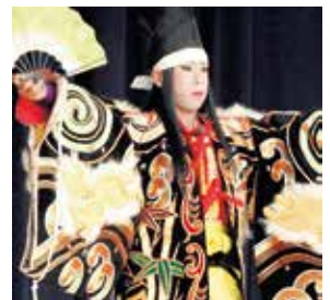
高校生神楽甲子園の様子