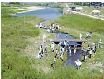
桂水辺の楽校（吉田町） 国土交通省HP

定されたときに定められました。その前までは，川の流れるそれぞれの地域において，可愛川，郷川，江川など様々な呼ばれ方をしていました。三次市より上流（安芸高田市方面）における江の川の本流は「可愛川」と呼ばれ、「日本書紀」（720年）にも可愛川が記されているそうです。昔から私たちに親しまれた名前です。