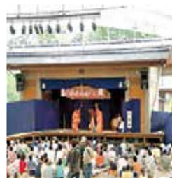
かぐら 神楽ドーム